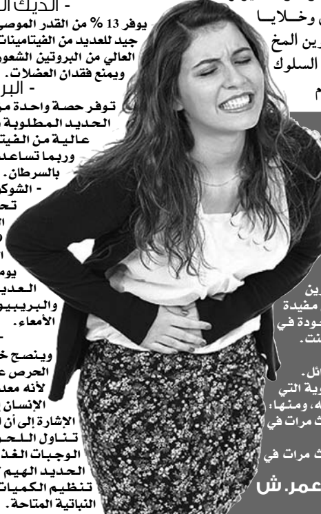
د/ عمر. ش

إلا أنه من المهم في أول الأعراض التأكد من أنه لا يوجد أي مرض آخر؛ وذلك بتحليل البراز للديدان ولطفيليات، والتأكد من عدم وجود التهاب في القولون. والأعراض تكون: 1- يشكك ألم في البطن متكرر ومضاجئ مصحوب بالرغبة في التغوط، وعادة ما يذهب الألم بالتغوط. 2- تغير في حالة التغوط الطبيعي، إما بإسهال أو إمساك. 3- ظهور غازات عبر الفم والشرج. 4- انتفاخ البطن، وأحياناً تقلصات مريئية. 5- عدم الارتياح أثناء التغوط والإحساس بعدم التغوط الكامل. 6- خروج مخاط. وما يميز القولون العصبي عن الأمراض العضوية، أن الألم في القولون العصبي لا يكون في الليل أثناء النوم - أي أنه لا يوقظ المريض من النوم - ولا يكون هناك خروج دم أو صديد في البراز، ولا يكون هناك نقص في الوزن. والأم القولون تكون في أي جزء من البطن،