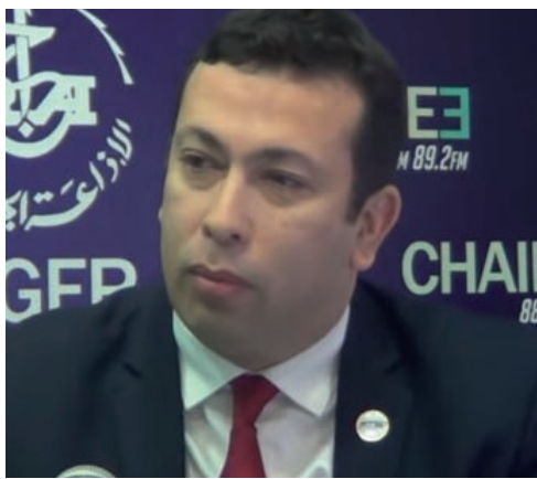
تحريك الدعوى العمومية ولعل آخرها كان بولايته غرداية