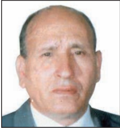
والمحافظة السياسية سابقا.