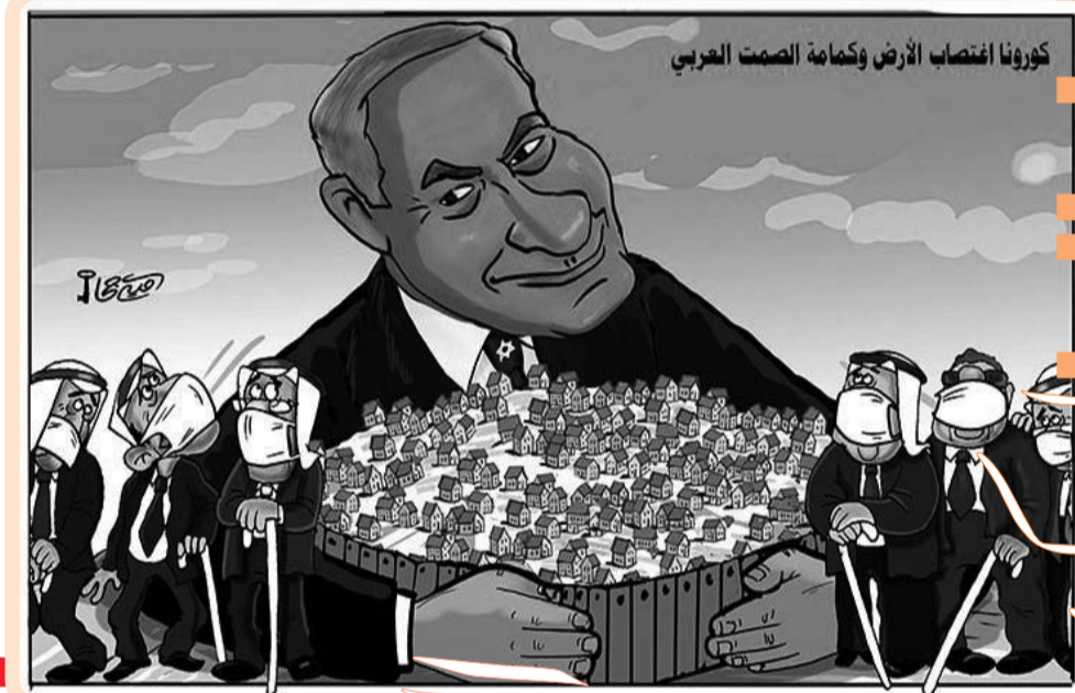
كورونا اغتصاب الأرض وكمامة الصمت العربي

أعلن وزير التجارة، كمال رزيق، عن فرض ارتداء التجار للكمامات الواقية إجباريا بداية من يوم الأحد، لمواجهة تمدد وباء كورونا "كوفيد 19" المستجد، مضيفا أن "عقوبات بالغلق لمدة شهر ستسلط في حالة عدم الالتزام بهذا الإجراء". وكان والي العاصمة يوسف شرفة قد أمر قبل أسبوع بإجبارية ارتداء التجار للكمامات الطبية، غير أنها لم تلق استجابة واسعة وسط التجار.