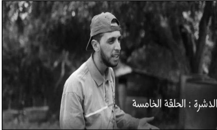
الذشرة : الحلقة الخامسة

كانت الداريجة فيها كثيرة الاستعمال ليستذكر بذلك ماضيه بما فيه من تاريخ وتراث، حسب ما ذكره مخرج وكاتب السلسلة. كما أوضح أن بيئة العمل متجانسة مع لغته، بحيث يجري تصويره إلى غاية اليوم عبر مناطق ريفية تقع ببلديات القرامم قوقة وحماله بميلة وسيدي معروف بولاية جيجل وذلك بمواقع تتوفر على المناظر الملائمة لموضوع السلسلة، كما ساهم ذلك أيضا في تسهيل العديد من الأمور التقنية خصوصا المتعلقة منها بالتصوير، وفقا لفتاح مزهود. وقال الكاتب والمخرج أيضا، "لم تكن لدينا نية تجسيد عدة حلقات من هذا العمل، إلا بعد أن تضاجنا بمدى انتشاره، ما جعلنا ندرك حجم التحدي لإنتاج المزيد من الحلقات مع إضفاء تطور تدريجي في أحداثها من عدد لآخر لجلب اهتمام المشاهدين أكثر". وباعتبار أن الظرف الراهن يعد خاصا مقارنة بالسنوات الماضية، يقول مزهود، حيث أن غالبية الناس ملتزمة بالحجر الصحي المفروض ليلا، سفقد زاد ذلك من عزم فريق العمل على المواصلة في إنتاجه بهدف تثبيت الناس أكثر في منازلهم من خلال ضمان سهرة رمضان ممتعة بمشاهدة سلسلة "الذشرة".