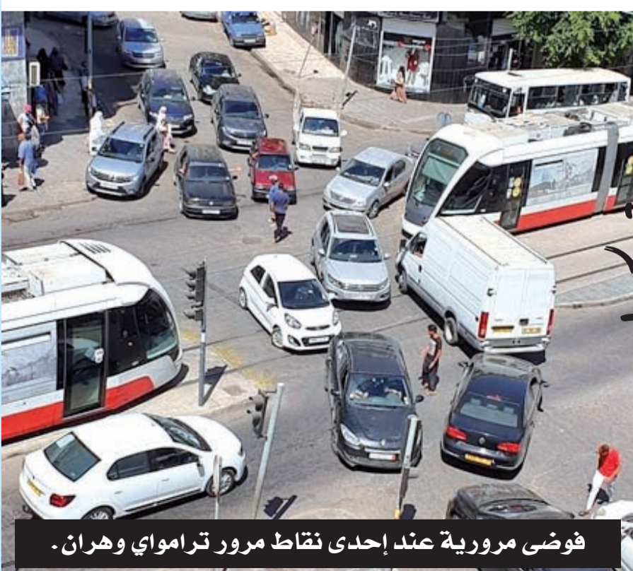
فوضى مرورية عند إحدى نقاط مرور ترامواي وهران.

وأحد الاحتمالات هو عمان، التي حضر سفيرها حفل البيت الأبيض، الثلاثاء. وتوقع ترامب في ذلك اليوم أن توافق السعودية في نهاية المطاف على اتفاق من هذا القبيل.